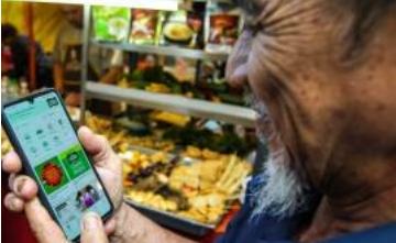
(/bisnes/2020/04/564165/grab-bawa-bazar-ramadan-ke-telefon-pintar) Grab bawa bazar Ramadan ke telefon pintar (/bisnes/2020/04/564165/grab-