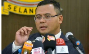
(/mutakhir/2020/04/568293/platform-e-dagang-khas-sembena-ramadan) Platform e-dagang khas sempena Ramadan