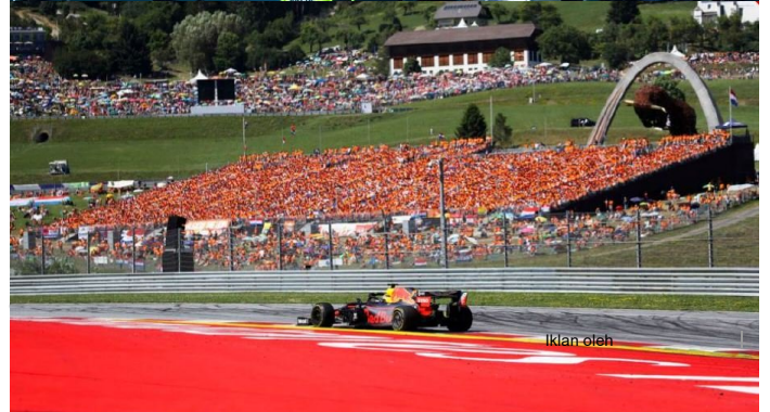
Grand Prix Austria tanpa penonton ( https://www.hmetro.com.my/arena/2020/04/572870/grand-prix-austria-tanpa-penonton?utm_source=hm&utm_campaign=recsys&utm_medium=recsys )