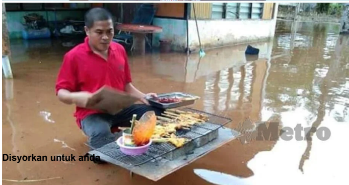
Disyorkan untuk anda 'Itu gambar hiasan' ( https://www.hmetro.com.my/mutakhir/2020/04/572883/itu-gambar-hiasan?utm_source=hm&utm_campaign=recsys&utm_medium=recsys )