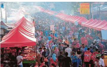
(/mutakhir/2020/04/566182/smart-iftarperak-ganti-bazar-ramadan-metrotv) S M A R T Iftar@Perak ganti bazar Ramadan [METROTV] ak-ganti-bazar-ramadan-metrotv)