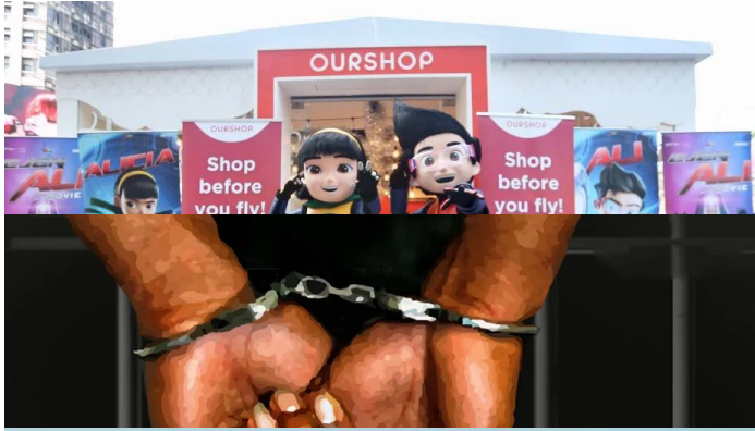
Penuhi keperluan masyarakat setempat (/node/209662)